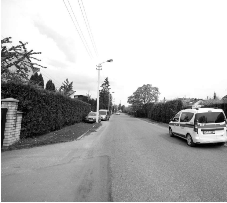
Kaimynai susipyko dėl tujų tvoros.