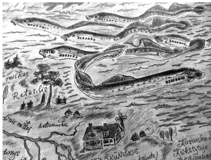
Į Šventąją prie Kavarsko užtvankos ankstyvą pavasarį neršti atplaukdavusios paslaptingosios jūrinės nėgės.

ir Utenos ir Vyžuonų vaizdai, rangosi didžiulis, tautiniais simboliais spindintis legendinis žaltys Vižas, po to mažytis Narunčio upelis, Aknysta, magiškoji Jara – Šetekšna su meknėmis ir legendinio ežero nendrynuose gyvenančiu Ūku, taip to krašto žmonės vadina baublius. Po to Pelyša ir priešistorinės riešapelėkės žuvis, Latava su karaliaus Mindaugo legenda, Rygos bokštai ir mažytėmis žuvelėmis, pavirstančiomis šprotais, viena šalia kitos sruvenančios upelaitės –